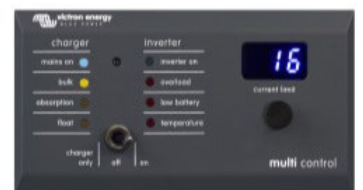
Tableau de commande numérique Multi Control

Afin d'implémenter les fonctions PowerControl et PowerAssist et pour optimiser l'autoconsommation grâce à une sonde de courant externe. Courant maximal : 50 A, 100 A respectivement. Longueur du câble de connexion : 1 m.